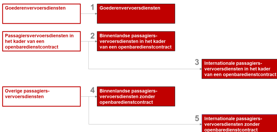
Figuur 1 De vijf marktsegmenten

In figuur 1 is dit grafisch weergegeven.